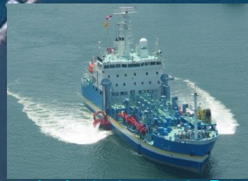
大型浚渫兼油回収船「白山」