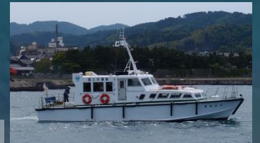
港湾業務艇「のとかぜ」